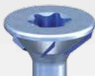
DNS ® plus TX-horonnyal