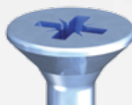
DNS ® PZ-horonnyal